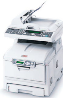
C5510 MFP C5540 MFP